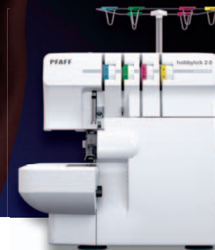
Funktionell | Snabb | Exakt

Perfekta kanter, mycket användbara sömmar!